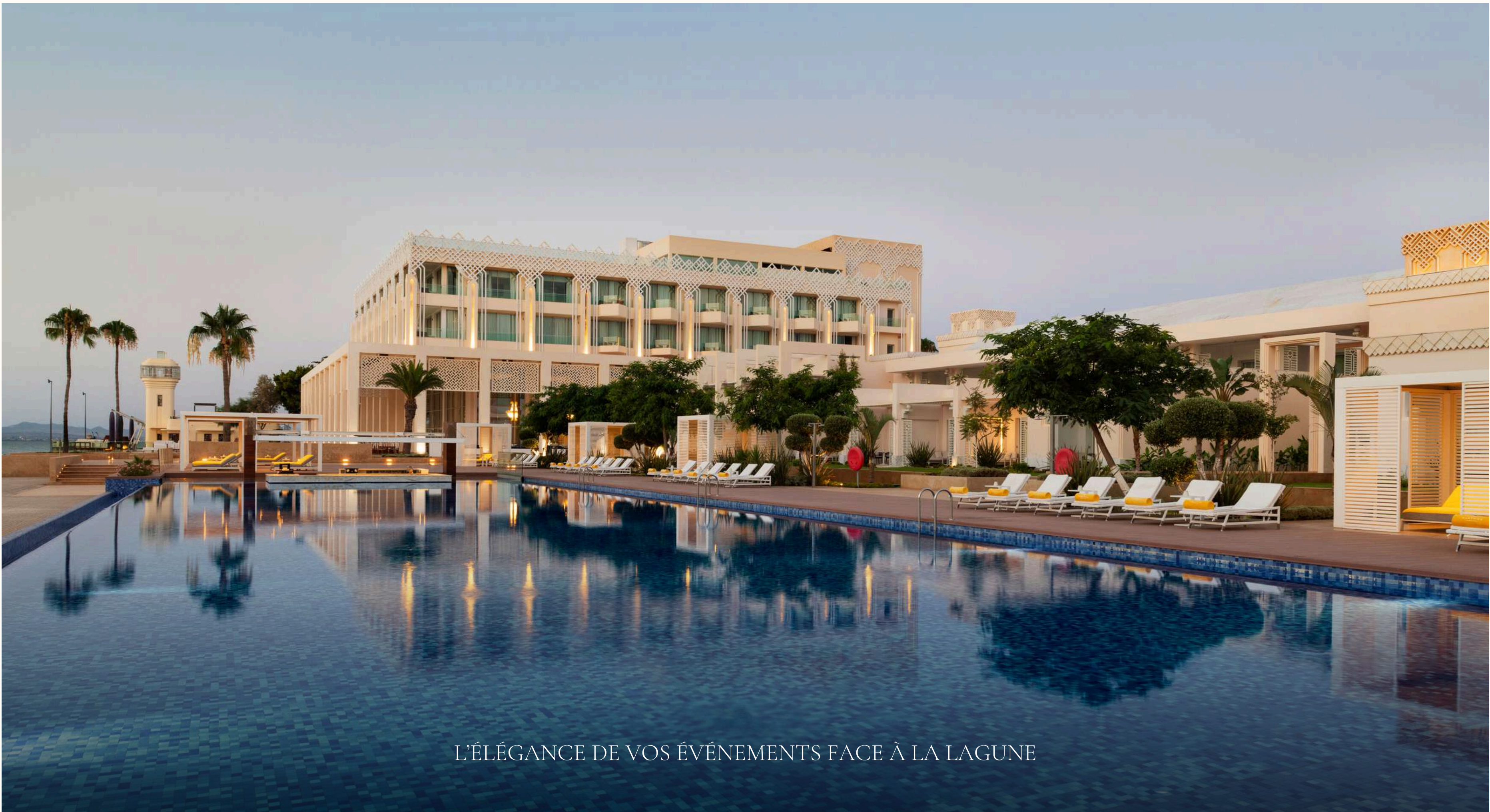
L'ÉLÉGANCE DE VOS ÉVÉNEMENTS FACE À LA LAGUNE